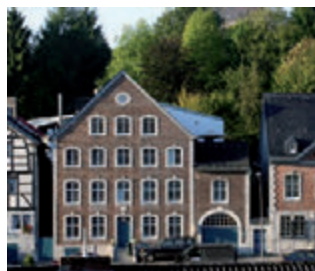
Das Stammhaus von 1789 - heute mit modernen Büroräumen

„Ethik, Moral, Achtung, Respekt, Lob und Anerkennung sind die Werte, die wir jeden Tag leben.“ Die Chefs und alle 25 Mitarbeiter begrüßen sich jeden Tag per Handschlag und schauen sich in die Augen. Der Mensch. ob Kunde oder Mit-