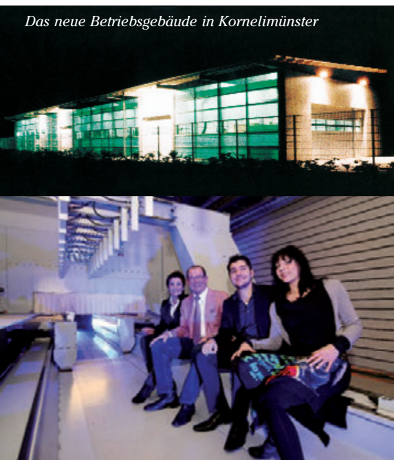
Das neue Betriebsgebäude in Kornelimünster

Vier Generationen und der Aufbruch ins Schreinerhandwerk des 21. Jahrhunderts: Dafür sowie für höchste Leistung, Qualität und neueste Technik steht die Schreinerei Brammertz aus Aachen-Kornelimünster. Mit einem Mitarbeiter-Team, das besser und motivierter kaum sein kann.