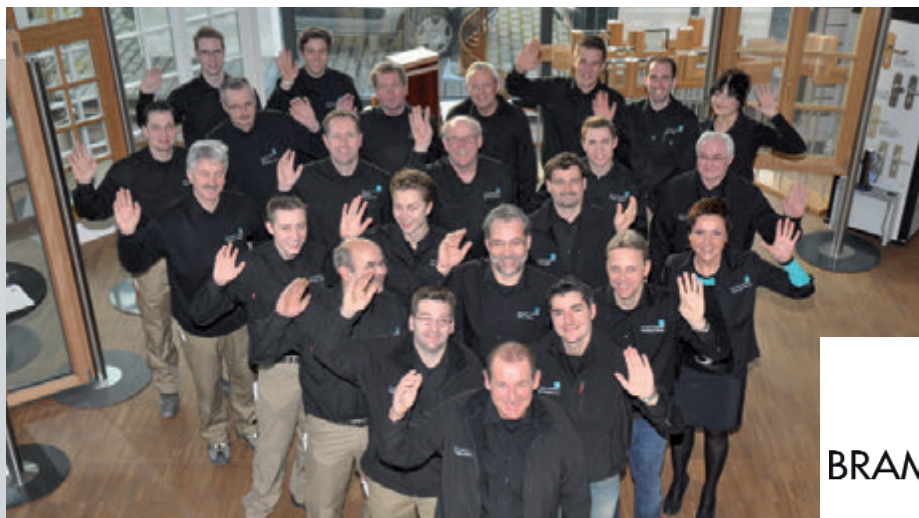
Das gesamte Team

arbeiter, steht bei Brammertz im Mittelpunkt. „Wir leben Kommunikation und Menschenführung; wir stehen für teamorientiertes Arbeiten, für Kreativität, absolute Qualität und Präzision.“ Das Ergebnis: Premium-Produkte, gefertigt von höchst motivierten und mitdenkenden Mitarbeitern. Womit sich der Kreis schließt - zugunsten der begeistertsten Kunden.